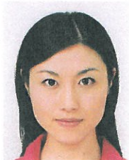
上三分身より大きいもの