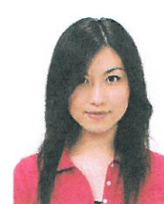
前髪が目元にかかっているもの