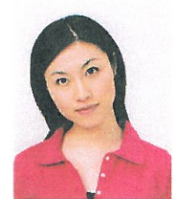
顔が左右に傾いているもの