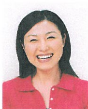
平常の顔貌と著しく異なるもの