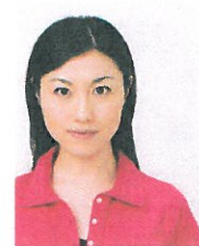
顔が左右に寄っているもの