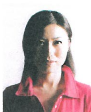
顔に影があるもの