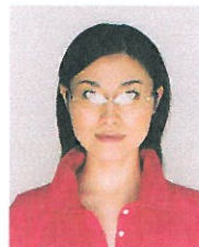
照明が眼鏡に反射したものの