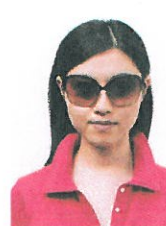
サングラスをかけているもの