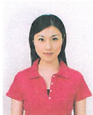
上三分身より小さいもの