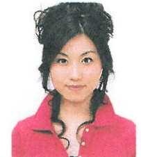
上部余白がないもの