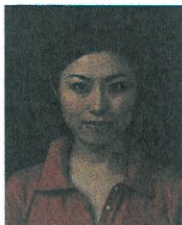
背景の色が濃く人物を特定できないもの