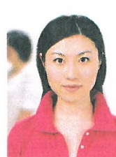
人物が写り込んでいるもの