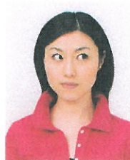
目線が正面でないもの