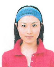
幅の広いヘアバンド等により頭部が隠れているもの