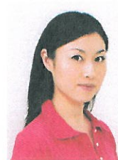
顔が横向きのもの