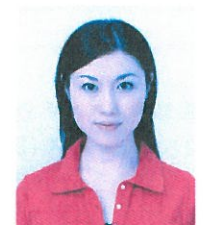
著しく変色しているもの